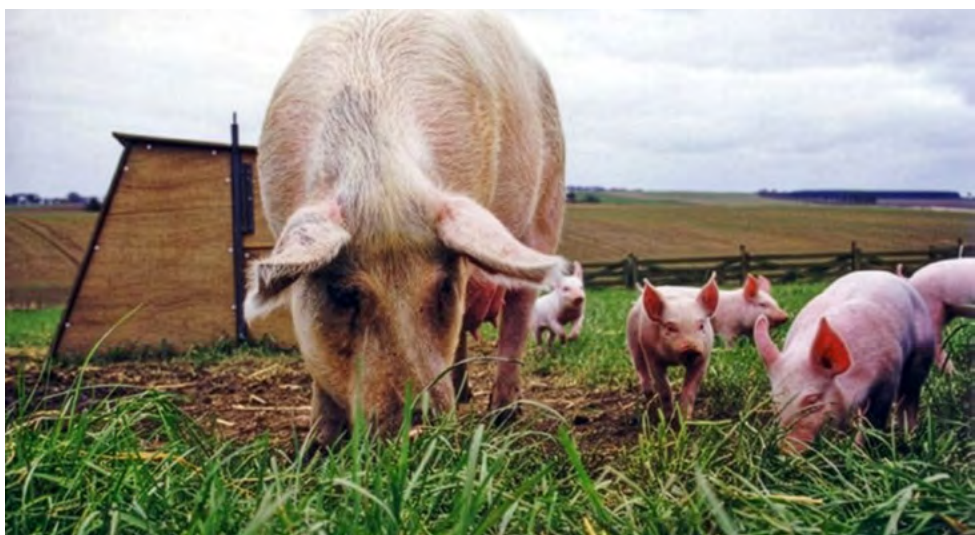
L'alimentació i el sistema de producció influeixen directament en la composició de la carn i, en conseqüència, en el seu perfil sensorial.

Tot i això, el sabor no es pot entendre de manera aïllada, ja que està estretament relacionat amb l'aroma. Part de la percepció sensorial de la carn depèn dels compostos volàtils que es generen durant la seva transformació. En estat cru, la carn presenta una expressió aromàtica limitada, mentre que durant la cocció es produeix generació de compostos responsables dels aromes característics.