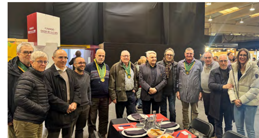
Els membres del jurat durant la deliberació a la Fira Orígens

El concurs ha comptat amb la participació de 19 elaboradors provinents d'11 comarques catalanes, una xifra que confirma tant la diversitat territorial com l'interès creixent per aquest tipus d'iniciatives dins del sector. En concret, hi han participat professionals d'Osona (6), Moianès