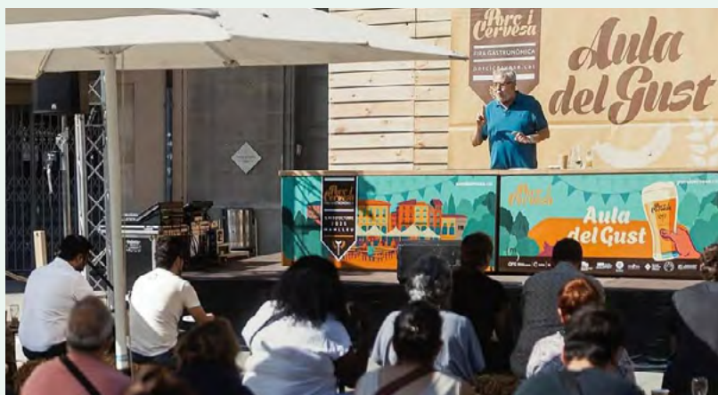
Tast a cegues d'embotits tradicionals Fira del Porc i la Cervesa de Manlleu

La participació de la Fundació va servir per reforçar el vincle entre producte, territori i ofici, apropant els embotits tradicionals tant a professionals com a públic general. El tast va permetre explicar l'origen i la singularitat de cada elaboració, posant en valor la feina dels elaboradors artesans i el paper de la Fundació en la difusió del patrimoni alimentari.