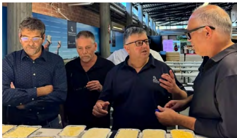
Membres del jurat observen els canelons del concurs

Fundada l'any 1899, Can Pericus és una carnisseria - xarcuteria amb una trajectòria centenària que ha sabut mantenir la continuïtat de l'ofici al llarg de diverses generacions. Al llarg del temps, l'establiment ha consolidat una manera de treballar basada en l'elaboració pròpia, en la selecció acurada de la matèria primera i en l'aplicació rigorosa de les tècniques tradicionals, adaptant-se als canvis del sector sense perdre la seva identitat.