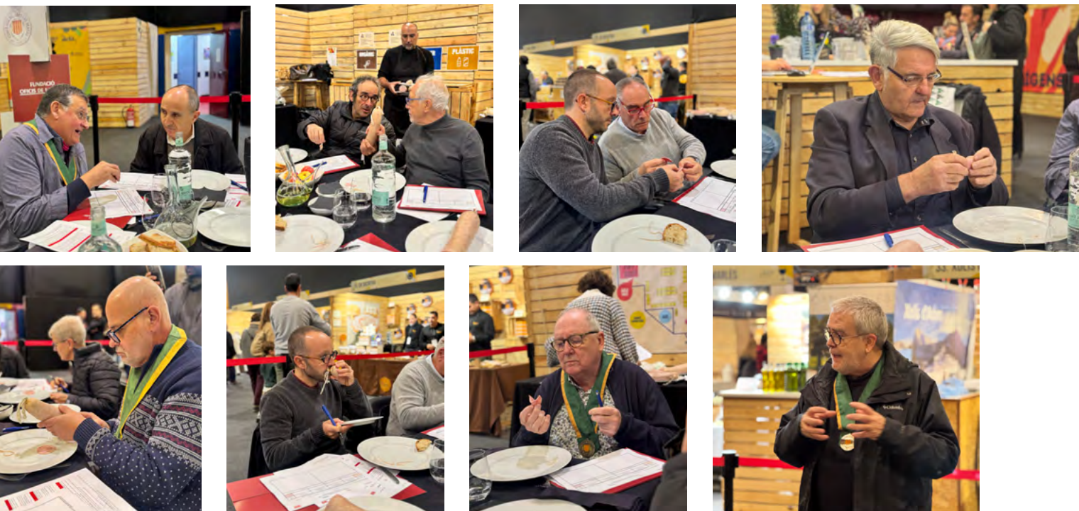
Imatges de la deliberació del jurat

pacència». Explica que seleccionen les carns, les tallen a ganivet i les deixen en maceració abans de la cocció. Després les emboteixen en tripa col·lar de la comarca i les deixen reposar fins a aconseguir la melositat justa. «Al final, gairebé sempre, tot és qüestió de paciència». Pel que fa a la seva botifarra catalana, en destaca la qualitat de la matèria primera i el respecte pel producte durant la cocció per aconseguir una peça «lleugera i suau, apta per a tots els públics».