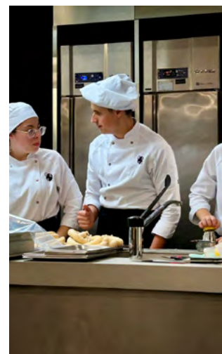
▼ Diferents moments de la formació als alumnes del 2n curs del grau de Ciències Culinàries del CETT

cessos tradicionals que hi ha al darrere. Entendre d'on ve la carn, com es treballa i quins criteris de qualitat s'apliquen és essencial per a qualsevol professional de la cuina que vulgui treballar amb rigor i respecte pel producte.