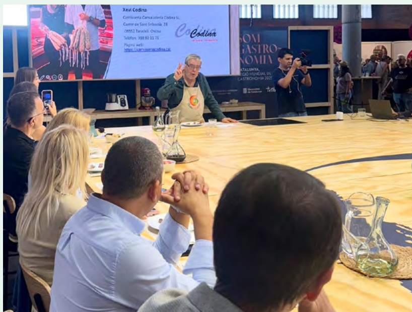
Tast d'Embotits d'Or Catalans - Fira MOS de Lleida

Els embotits i la tradició xarcutera són grans ambaixadors de la gastronomia catalana, ja que concentren tradició, cultura i patrimoni alimentari. En aquest context,