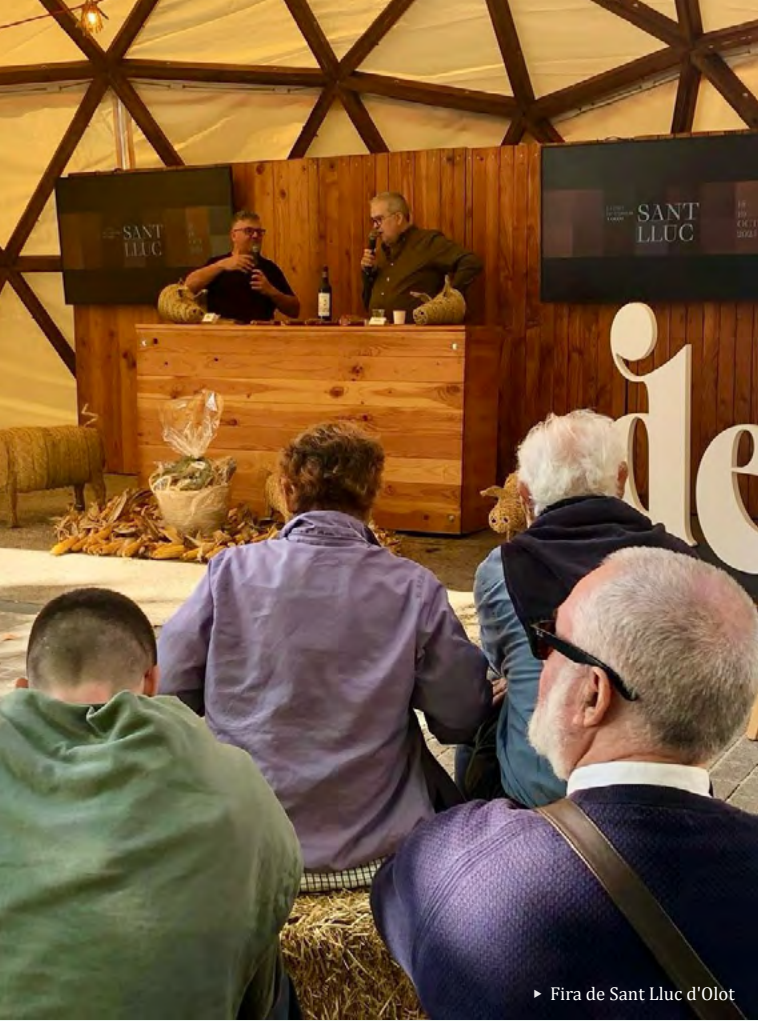
► Fira de Sant Lluç d'Olot

— La participació de la Fundació Oficis de la Carn en fires d'arreu del país permet connectar producte, territori i professionals, i reforçar la divulgació dels embotits tradicionals.