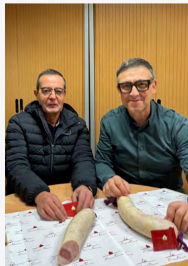
MENCIÓ DEL JURAT URBICI ESCUDÉ

“El secret és molta feina i molta paciència. Seleccionem les carns, les treballem amb cura i respectem els temps perquè el producte tingui l'equilibri que busquem.”